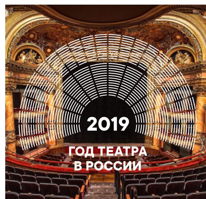
Размещение однотонного логотипа на детализированных фото-материалах