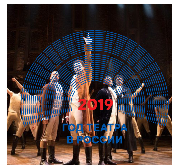
Размещение цветного логотипа на любых фото-материалах