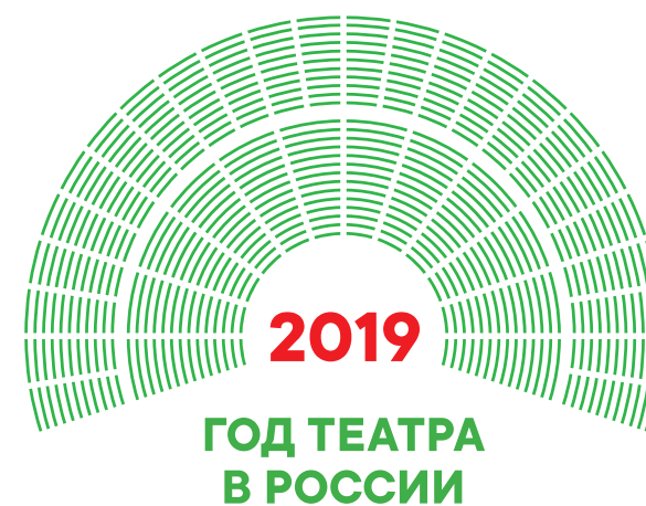
Изменение цвета логотипа