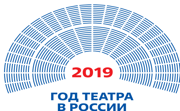
Искажение пропорций логотипа