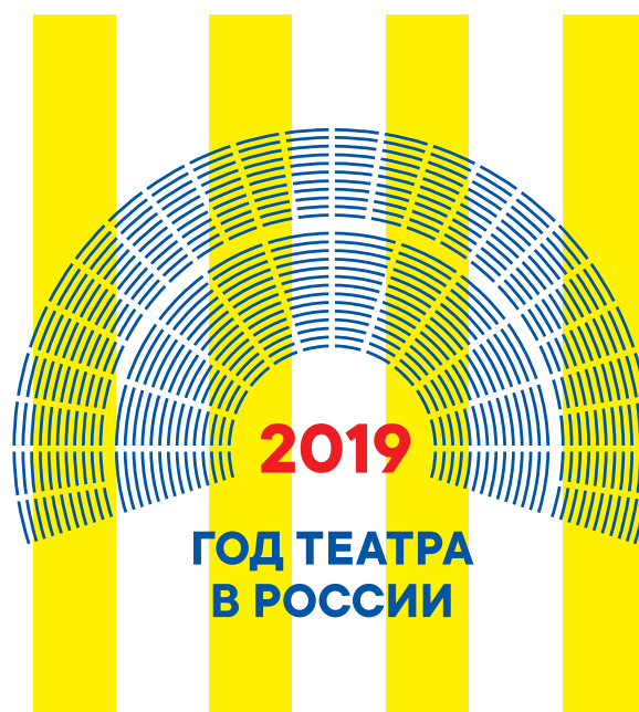
Размещение на паттернах