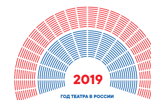
Использование логотипа для крупного регистра в маленьком размере