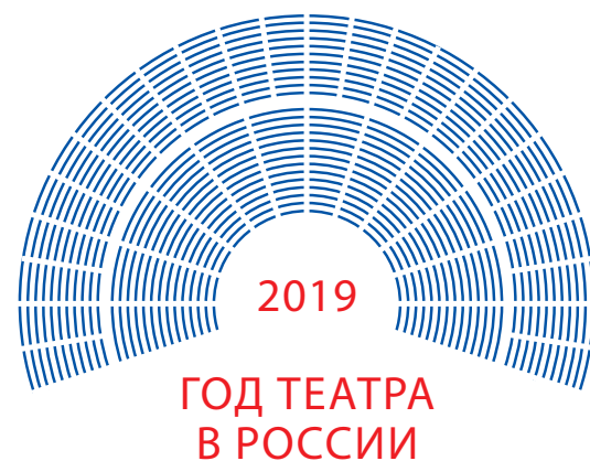
Использование другого шрифта