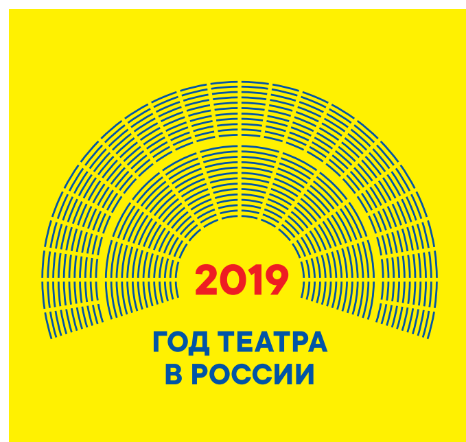
Размещение цветной версии логотипа на любом цветном или черном поле